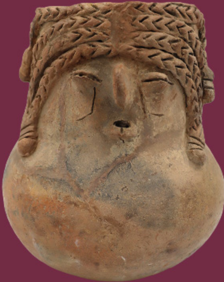
Jarro Monocromo Cerámica

Se trata de un jarro monocromo alisado y representa una figura humana con expresivos rasgos faciales. La pieza está