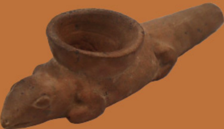
Pipa o Cachimba Cerámica