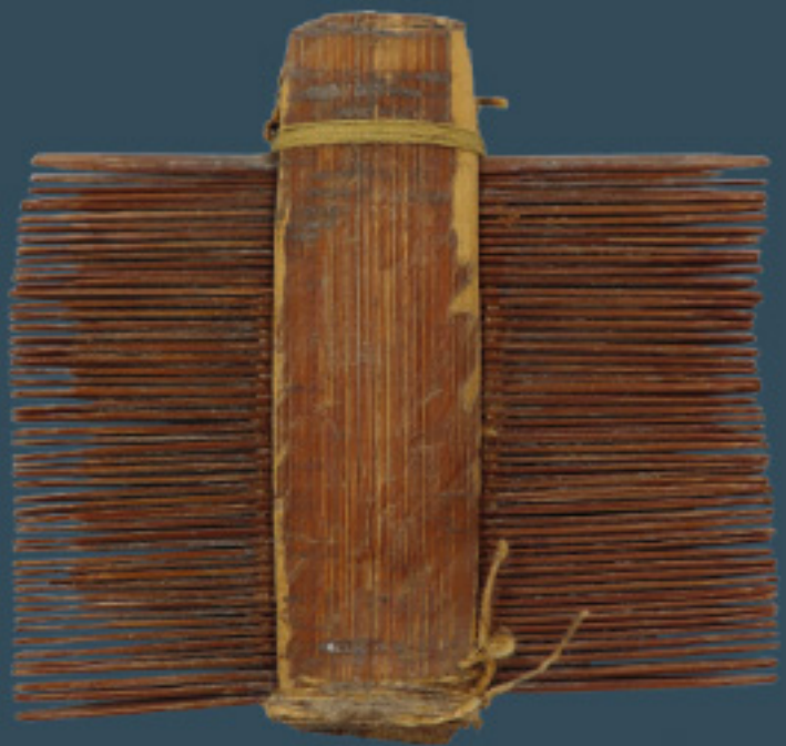
Peineta Espinas de cactus