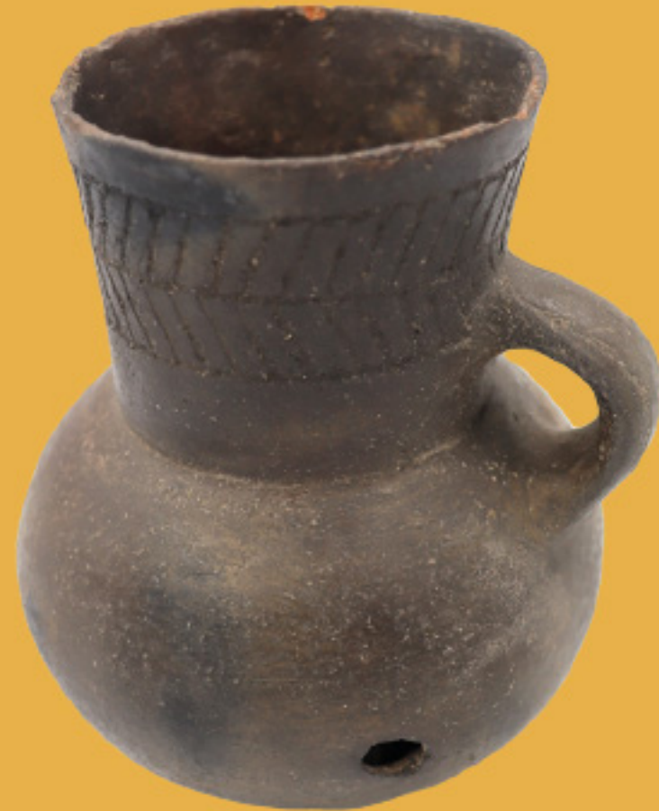
Jarro Grabado Cerámica

Complejo El Bato (Chile Central) 200 -1000 d. C.