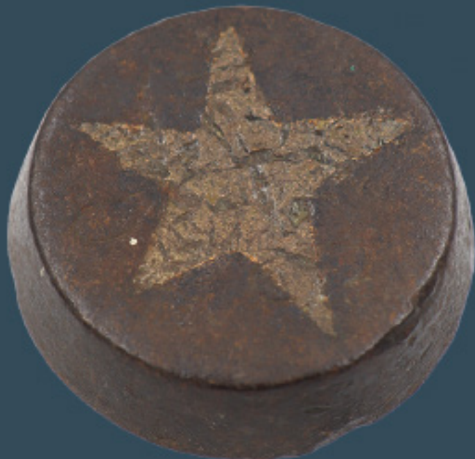
Tejos para jugar rayuela. Hierro y Bronce