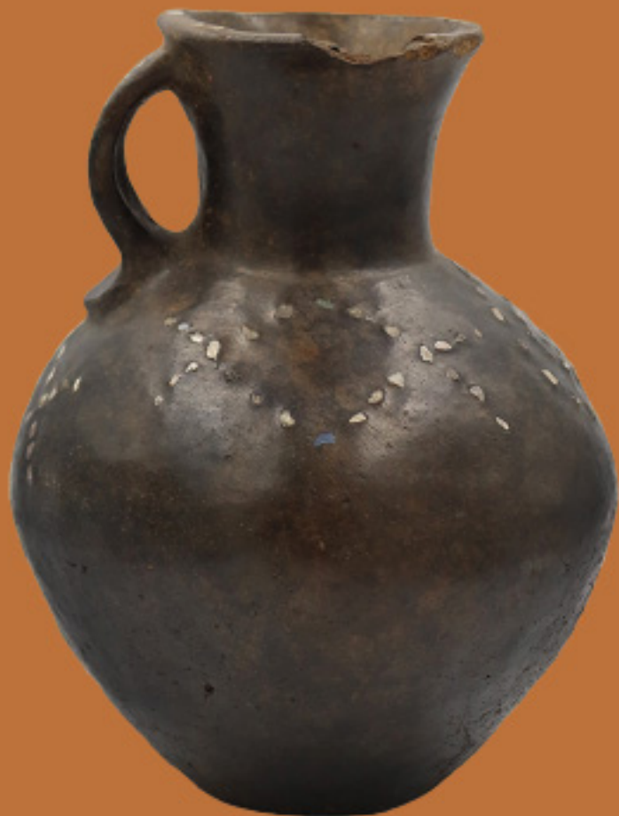
Metagües: Jarros con incrustaciones de loza Cerámica